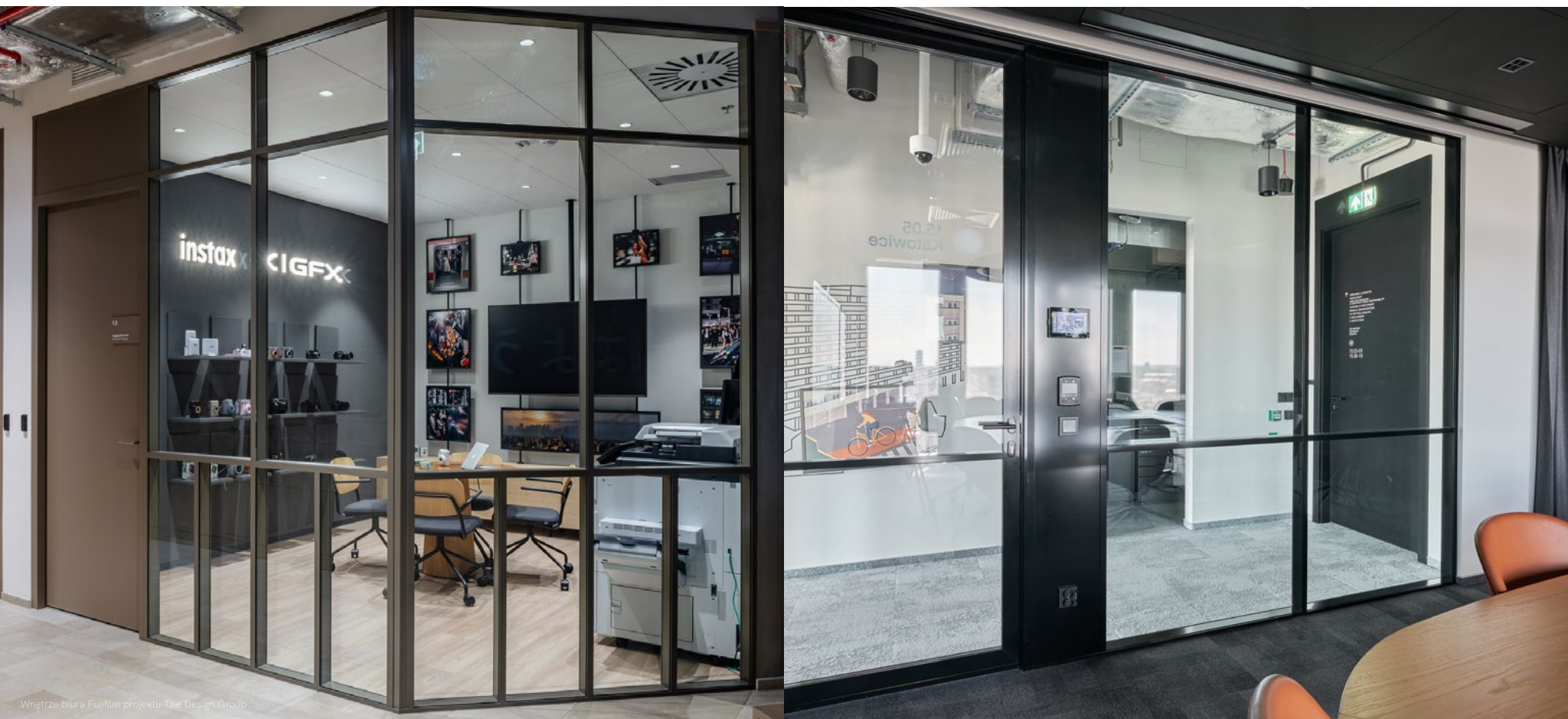
Wnętrze biura Fujifilm projektu The Design Group