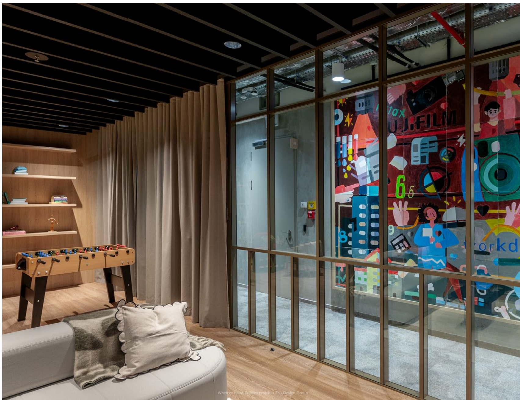
Wnętrze biura Fujifilm projektu The Design Group

Ultra silence loft lets silence define your style